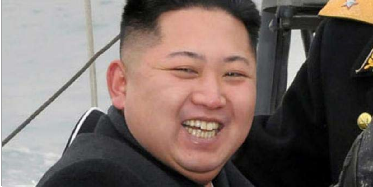
يا ترى من سيضحك أخيرا

كشفت الحكومة اليابانية عن خطة جديدة لتعزيز الأمن البحري حول الجزر المتنازع عليها مع الصين وتايوان في بحر الصين الشرقي. وأفادت هيئة الإذاعة والتلفزيون اليابانية NHK أمس أن أعضاء الحكومة أصدروا مسودة لخطة بحرية مدتها خمس سنوات، وتشير الوثيقة إلى أنه رغم بعض السفن الأجنبية التي تجرى أبحاثا بحرية في المياه اليابانية دون الحصول على موافقة مسبقة. وتقول إن الحكومة سوف تطبق القانون الياباني في التعامل مع مثل هذه الحوادث. وتنص الخطة على ان اليابان سوف تراقب وتحمي مناطقها الحساسة البعيدة ومن المنتظر أن يتم نشر قوات الدفاع الذاتي البرية اليابانية في جزيرة يوناغوني في أقصى غرب اليابان، التابعة لمحافظة أوكيناوا. كما تخطط وزارة الدفاع اليابانية لوضع أنظمة رادار متنقلة تابعة لقوات الدفاع الذاتي الجوية اليابانية في الجزيرة. وتشمل الخطة مجالات للتنقيب عن الغاز الطبيعي من مخزون هيدرات الميثان الموجود في قاع البحر. وسوف يقضي المسؤولون ثلاث سنوات في إجراء مسح لتحديد حجمه، ويأملون البدء في إنتاجه على نطاق تجاري في حوالي عام 2018. يشار إلى ان اليابان تسيطر على الجزر المتنازع عليها بين طوكيو وكل من بيجينغ وقايبه، وتطلق عليها اسم سينكاكو، فيما تسميها الصين دياويو.